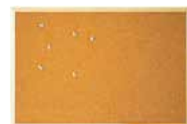
TABLEAU – ULMANN