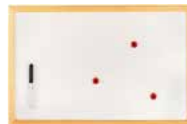
TABLEAU – ULMANN