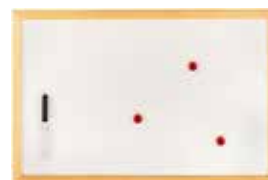
TABLEAU – ULMANN