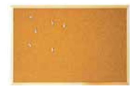
TABLEAU – ULMANN